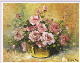
H.4 malowane ustami Autor: J. May