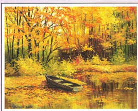
H.1 malowane stopą Autor: Stanisław Kmieciak