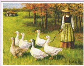
H.3 malowane ustami Autor: N. Litteral