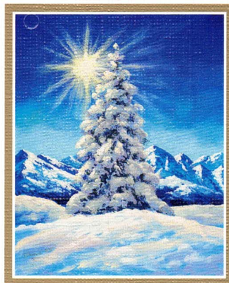
Oryginał malowany ustami i stopą Autor: Stanisław Kmieciak