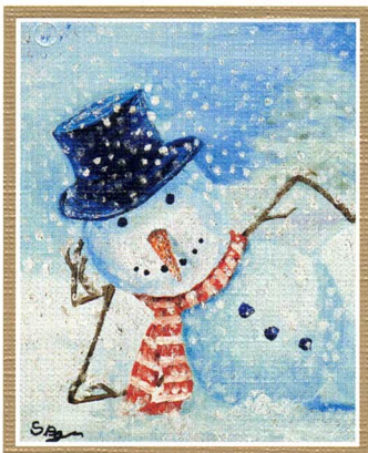
Oryginał malowany ustami Autor: Agnieszka Sapińska