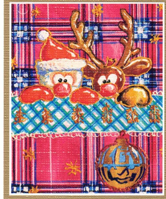
Oryginał malowany ustami i stopą Autor: Stanisław Kmieciak